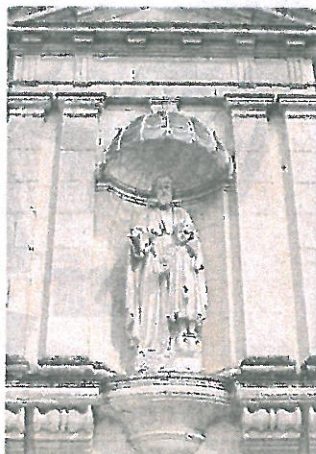
Les portiques en tuf et les statues de la Vierge Marie et saint Joseph (photo) seront déposés et réinsérés.