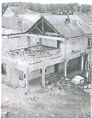
L'ancienne laverie est en cours de déconstruction. Les éléments de tuffeau sont récupérés. C'est là que se situent l'entrée-jardin et les places de stationnement.