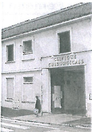
Toute la construction à gauche du porche d'entrée sera démolie. Une entrée-jardin et des places de stationnement y verront le jour.