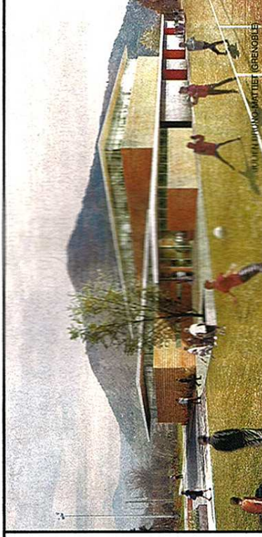
TOULOUSE PARTIET (GRENOBLE)