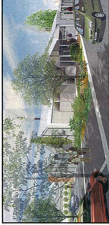
TOM DARNOU (PARIS)

Tous les résultats de concours envoyés au « Moniteur » sont publiés gratuitement