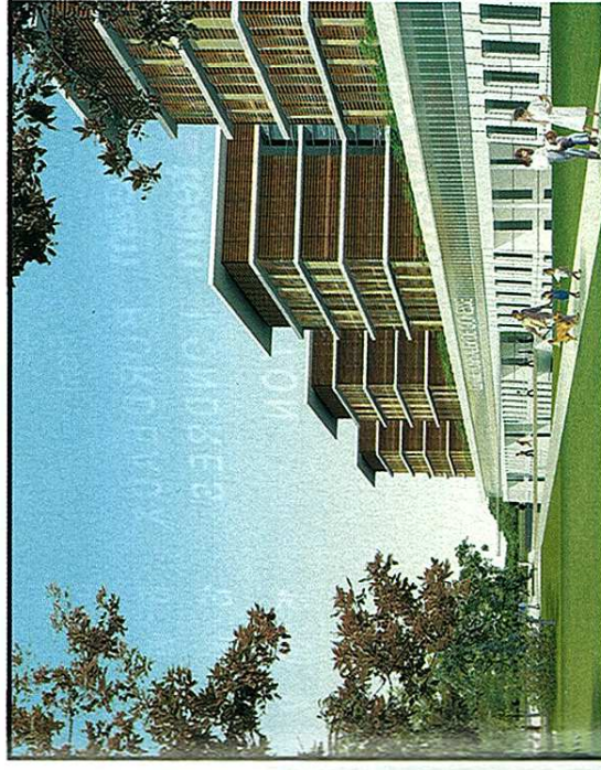
VALODE & PISTRE ARCHITECTES