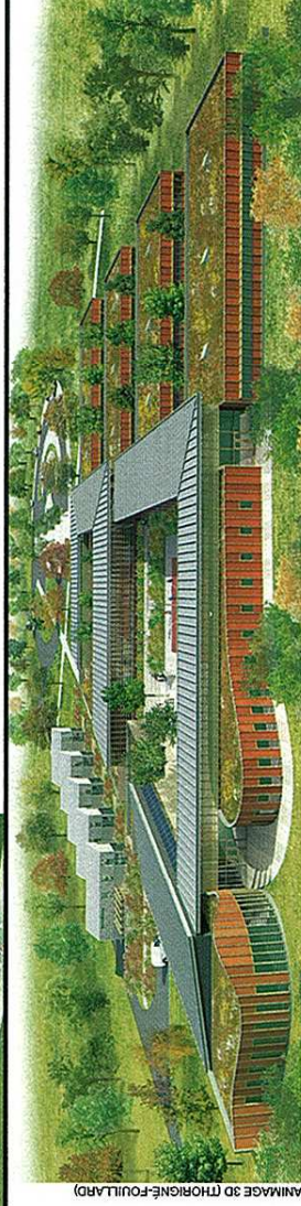
AMNAGE 3D (THORIGNÉ-FOUILLAND)

Calendrier prévisionnel : PC, octobre 2006 ; début des travaux, juin 2007.